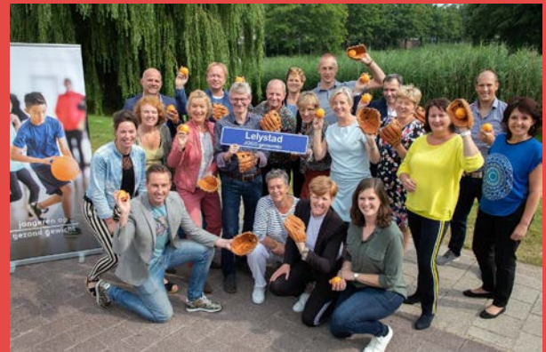
Kick-off JOGG Lelystad