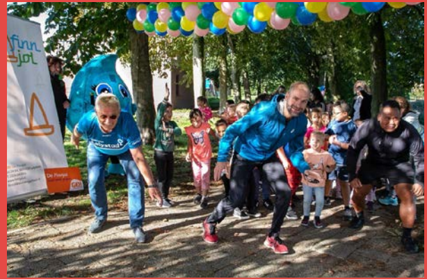
Kick-off Daily Mile OBS De Finnjol

Er zijn diverse persmomenten geweest, zoals de kick off van JOGG Lelystad, de uitreiking van drankenborden op 2 basisscholen en de kick-off van de campagne Drink Water en Daily Mile met de wethouder en Erben Wennemars.